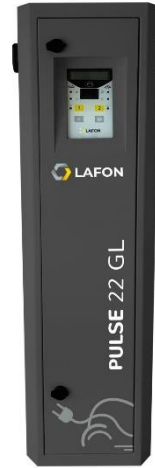
Borne de charge PULSE 22 GL 2 x 11 kW AC