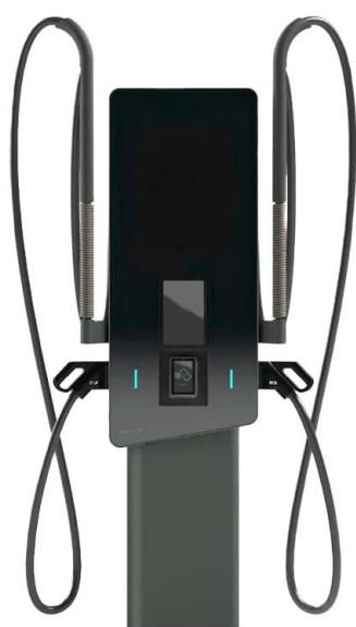
Borne de charge HYC 50 2 x 25 kW DC